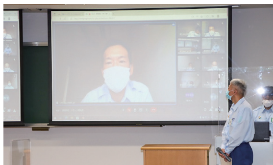
課題研究発表（ハイブリッド形式）

教室の感染対策については、講師と学生との距離を十分確保し、教室内に複数台のサーキュレーターや二酸化炭素測定器を設置し、十分な換気を行うとともに、休憩時には講師が使用したマイクや教壇を学生が主体となり消毒を行います。