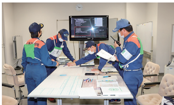
指揮シミュレーション訓練

本年度は、昨今の消防行政を取り巻く環境を踏まえ、以下の授業科目を新設するなど、カリキュラムの一部見直しを行いました。